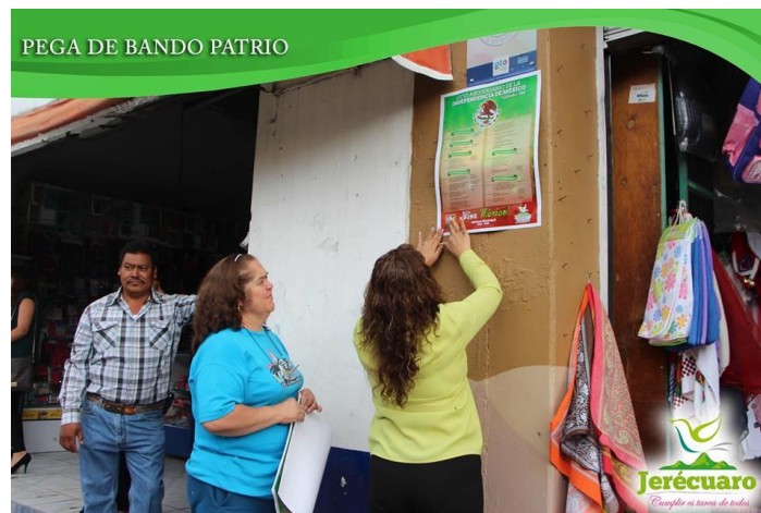
COLOCACIÓN DEL BANDO PATRIO EN NEGOCIOS DEL CENTRO HISTÓRICO