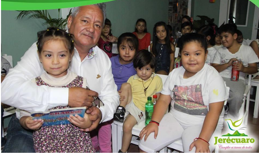
PARTICIPACIÓN DE CHICOS Y GRANDES

ADMINISTRACIÓN 2015 - 2018 JERÉCUARO, GTO.