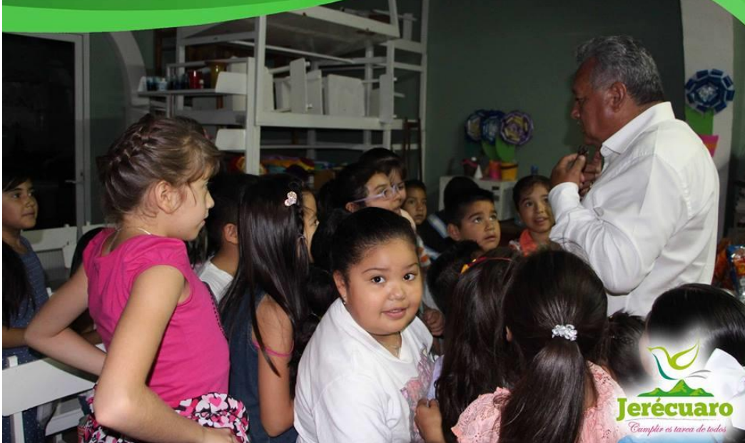
TODOS PODEMOS COMPARTIR UN RELATO

ADMINISTRACIÓN 2015 - 2018 JERÉCUARO, GTO.