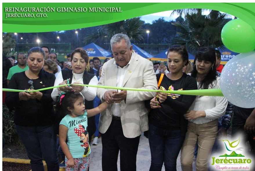
CORTEDEL LISTÓN EN COMPAÑÍA DE INTEGANTES DEL H. AYUNTAMIENTO