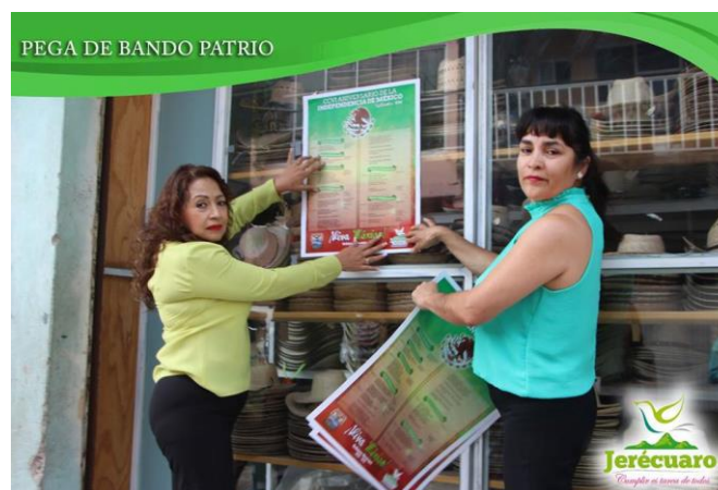
LOS COMERCIANTES ESTABLECIDOS RECIBIERON CON AGRADO EL BANDO SOLEMNE