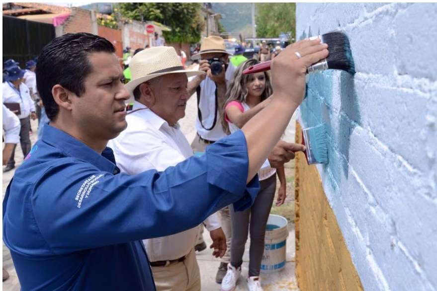
PINTANDO EL MURAL EN LA LOCALIDAD DE PURUAGUA