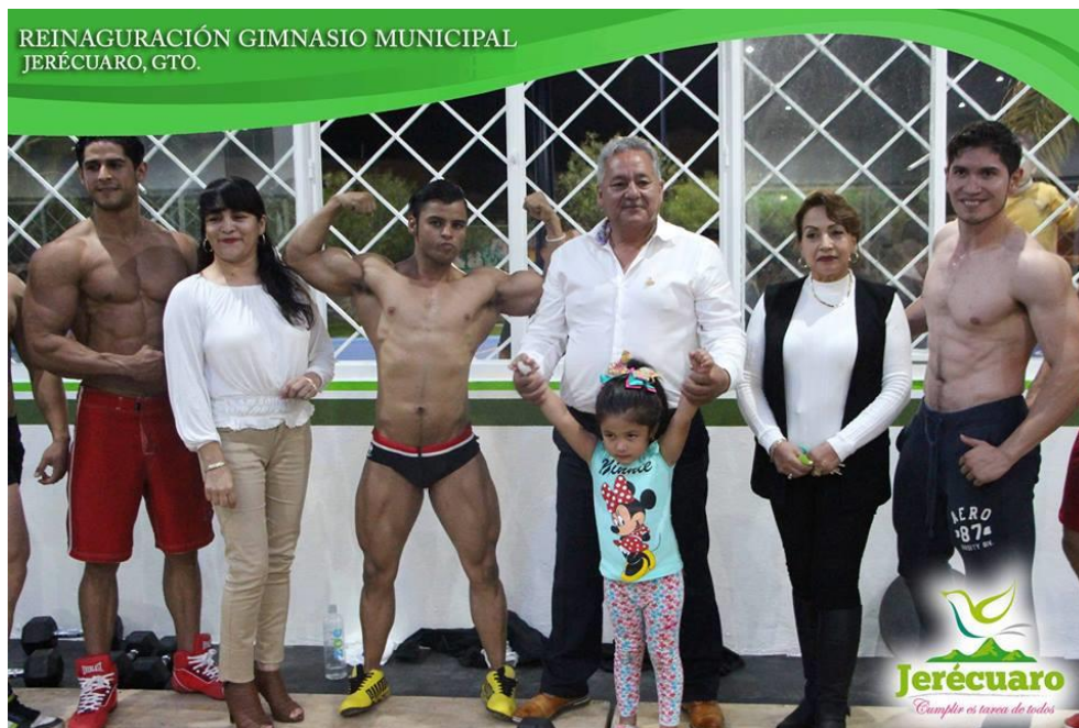
PARTICIPACIÓN DE DEPORTISTAS INVITADOS AL EVENTO