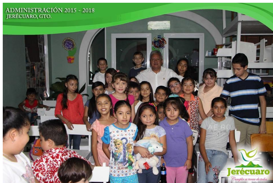
UNA FOTO QUE PERDURARÁ EN EL RECUERDO DE NUESTRA NIÑEZ JERECUARENSE