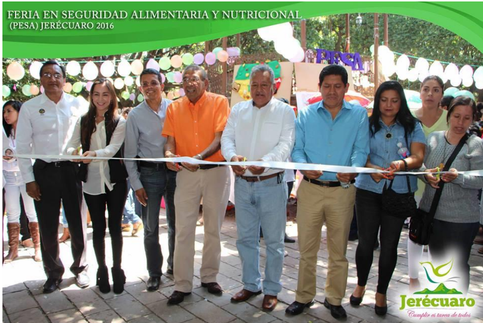
INAUGURACIÓN DE LA MUESTRA GASTRONÓMICA