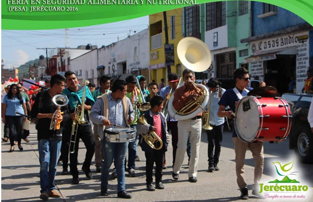
PARTICIPACIÓN QUE SE AGRADECE DE LA BANDA DE VIENTO SAN MIGUEL DE LA LOCALIDAD DE ESTANZUELA DE RAZO