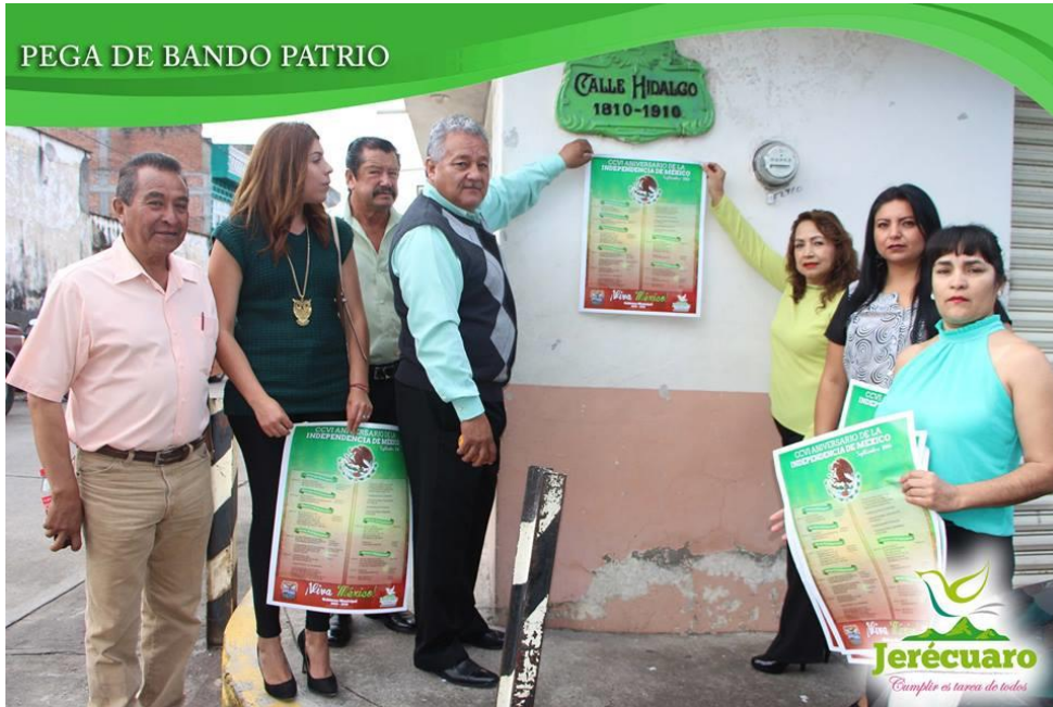
COLOCACIÓN DEL BANDO SOLEMNE EN LA ESQUINA QUE FORMAN LAS ACALLES HIDALGO Y ALDAMA, EN DONE SE ENCUENTRA LA PLACA CONMEMORATIVA DEL PRIMER ANIVERSARIO DEL INICIO DE LA LUCHA DE INDEPENDENCIA