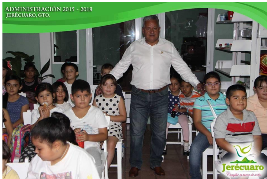
ALCALDE JORGE VEGA CASTILLO ACOMPAÑANDO A LOS NIÑOS EN EL CURSO DE VERANO DE BIBLIOTECA MUNICIPAL

SE TUVO LA PARTICIPACIÓN EN LOS TALLERES DE PROMOCIÓN A LA LECTURA ORGANIZADOS POR LA BIBLIOTECA MUNICIPAL “JOSÉ AGUILAR Y MAYA”, DESDE EL APOYO CON LA ELABORACIÓN DE CARTELES PARA SU PROMOCIÓN, DISPOSICIÓN DE MOBILIARIO, EQUIPO Y MATERIALES. ADEMÁS SE PARTICIPÓ CON EL CUENTO “JUAN SIN MIEDO” DIRIGIDO A LOS NIÑOS PARTICIPANTES EN ESTAS ACTIVIDADES.