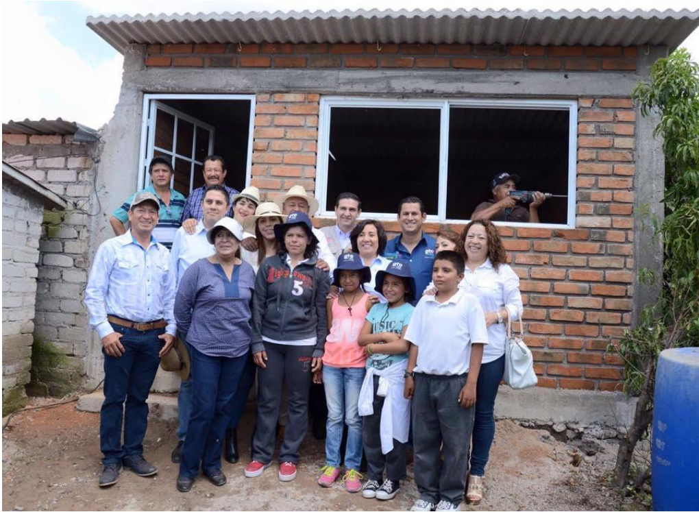
ENTREGA DE VIVIENDA A UNA FAMILIA EN LA LOCALIDAD DE PURUAGUA