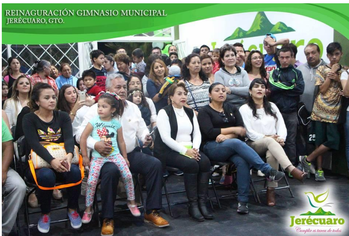
REALIZACIÓN DE UN EVENTO DE DEMOSTRACIÓN CORRESPONDIENTE A LA DISCIPLINA DE GIMNASIO