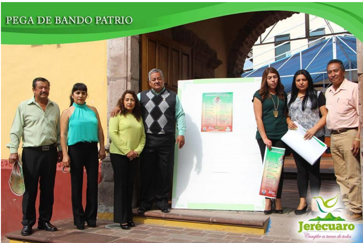
COLOCACIÓN DEL BANDO SOLEMNE EN CADA DE CULTURA "RAYMUNDO CORNEJO LÓPEZ"