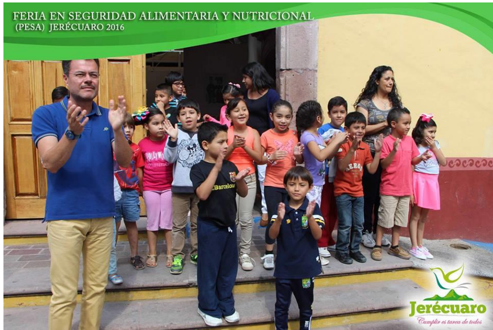
MAESTRO Y ALUMNOS DE CURSOS DE VERANO DE CASA DE CULTURA PRESENCIANDO EL DESFILE