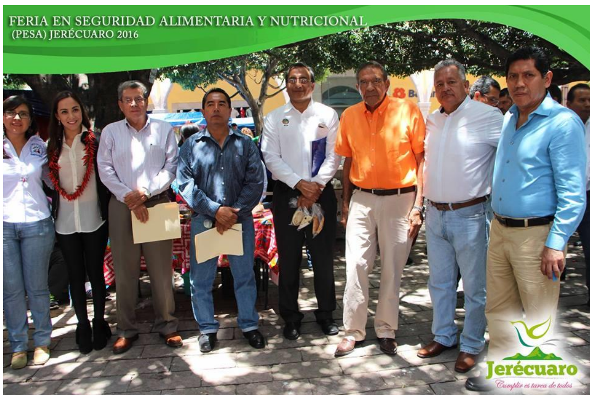
CLAUSURA GENERAL DEL EVENTO